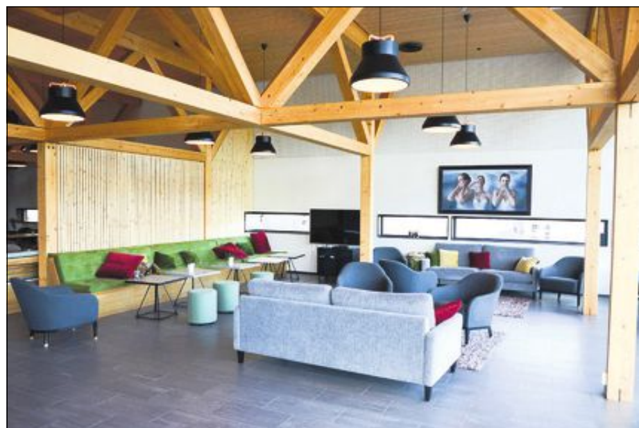
TV-STUE: I tv-stua samles elvene for å se nyheter hver morgen.